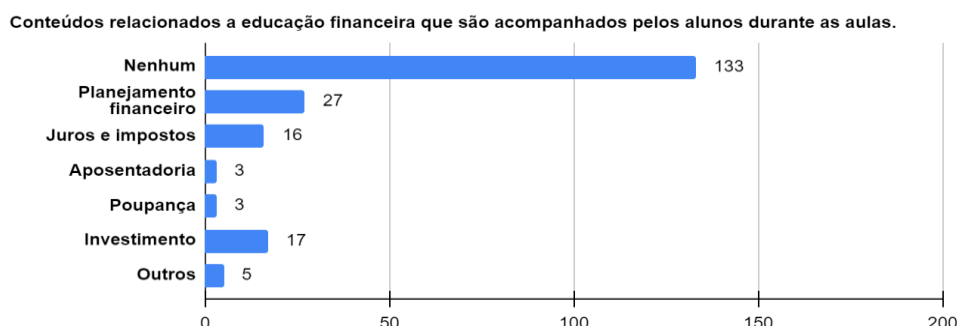
Gráfico 1 - Conteúdos relacionados à educação financeira acompanhados pelos alunos durante as aulas.

A Tabela 3 apresenta o nível de conhecimento financeiro de acordo com o ano escolar cursado pelos discentes atualmente. O maior índice de educação financeira está entre os alunos do 2º ano do Ensino Médio. Apesar disso, os resultados do grupo não expressam diferença significativa, o que indica que não existe correlação relevante entre o ano escolar e o nível de conhecimento financeiro.